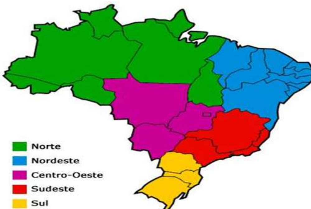
Mapa do Brasil - Político, regiões, estados e capitais, rodoviário (escolaeducacao.com.br)

Observe os mapas a seguir e tente responder as questões em seu caderno: