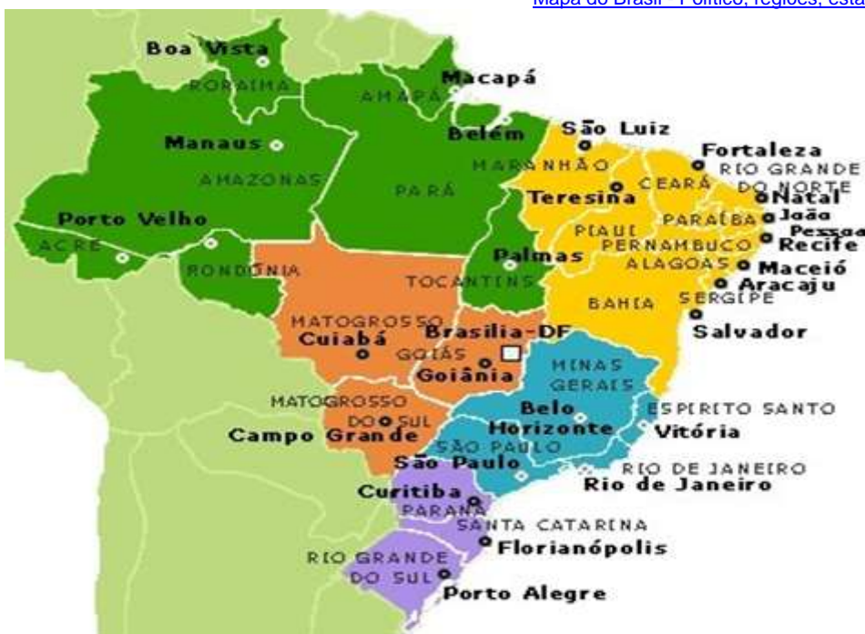
Mapa político do Brasil - Brainly.com.br