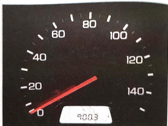
Hodômetro do carro.