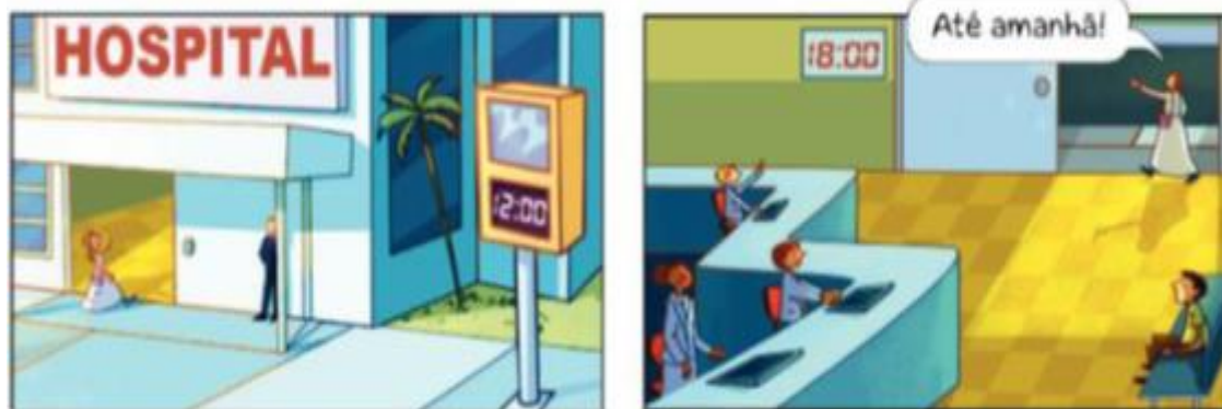
(Atividades baseadas no livro Ápis; Matemática, p. 77)

2) Quantas horas Fabiana ficou no hospital nesse dia?