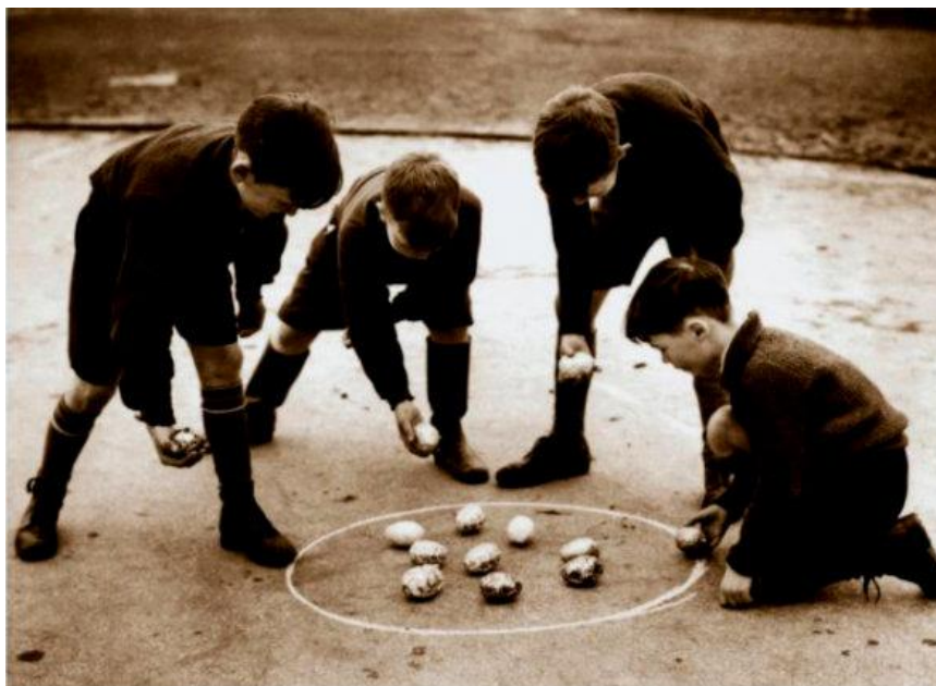
Meninos brincando com um jogo semelhante ao de bolinhas de gude, no qual se utilizavam pedras em forma de ovo de Páscoa. Londres, Inglaterra, 1940.

(Atividades baseadas no livro didático Buriti Mais História ; p. 38 - 4º ano)