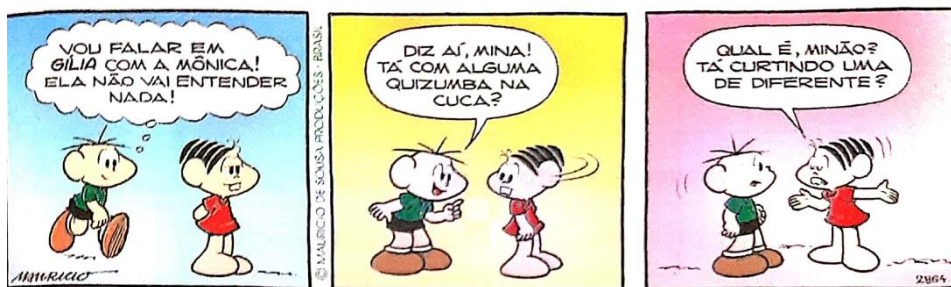
Mauricio de Sousa. As tiras clássicas da turma da Mônica. São Paulo: Panini Comics Editora, 2011. p. 58. v. 7.

Na aula de hoje continuaremos a falar de GÍRIAS . Para isso interpretaremos uma tirinha de história em quadrinhos entre Mônica e Cebolinha. Leiam e copiem as questões a seguir: