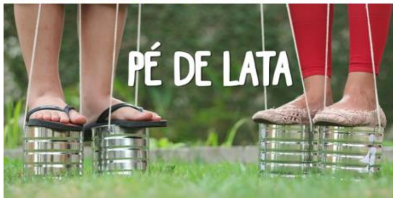
PÉ DE LATA