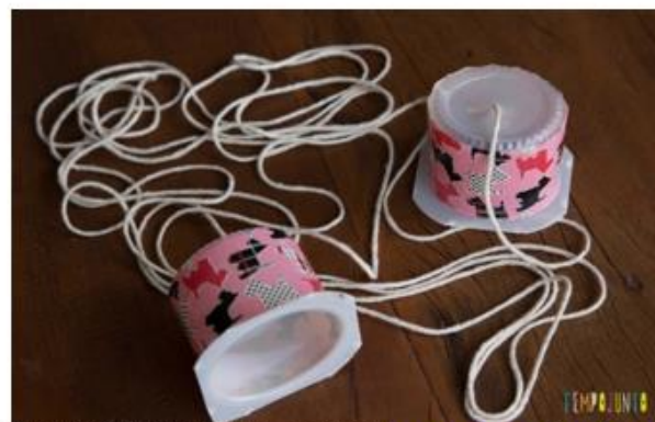
TELEFONE SEM FIO